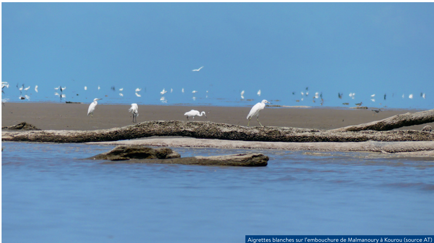
Aigrettes blanches sur l'embouchure de Malmanoury à Kourou